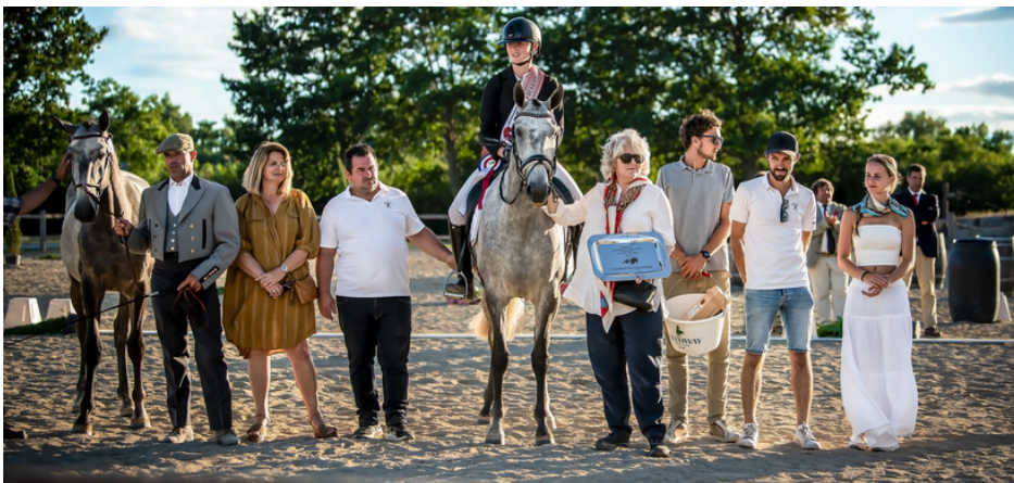
Prague de la Gesse Championne des Champions 2023

Aujourd'hui, l'amateur comme le cavalier professionnel trouvent dans l'élevage français d'excellentes montures pour le dressage mais aussi pour l'équitation de travail, l'attelage, et bien sûr le loisir, où ce cheval se révèle un choix judicieux, formidable compagnon facile et confortable.