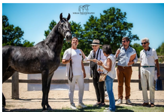
Quercus du Fesquet Prix Sauveur Vaïsse 2023