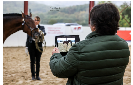
Epreuve de confirmation et approbation de candidats reproducteurs