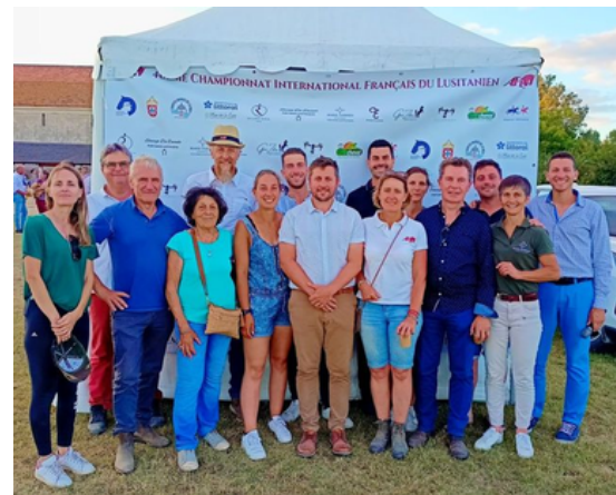
L'équipe du CA en juillet 2023